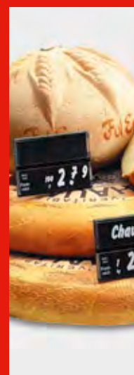
Soluciones de Merchandising