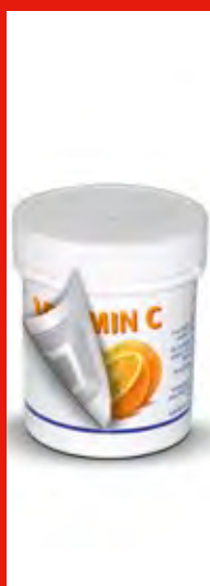
Etiquetado en origen