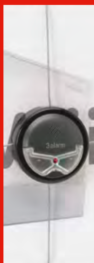
Soluciones para niveles de hurto elevados