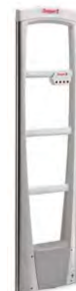
Antena EVOLVE P10 con unidad integrada EVOLVE VisiPlus™

EVOLVE significa evolución. Como su nombre indica, nuestra gama EVOLVE ha sido diseñada para evolucionar con el negocio del minorista. Desde el principio, esta gama se ha concebido como una plataforma abierta capaz de incorporar fácilmente nuevas funciones como RFID, redes avanzadas y detección de bolsas de aluminio y de integrarse sin problemas con otros sistemas de prevención de pérdidas.