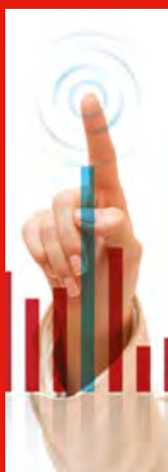
Software para la gestión del hurto